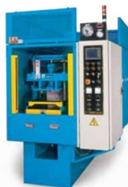
CE歐洲安規機型 CE CONFORMITY TYPE