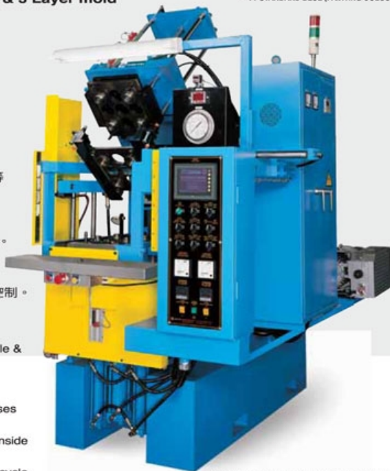
拍板左移機型 多功能離型機構 LEFTSIDE OPEN TYPE Multi-function Mold Stripping