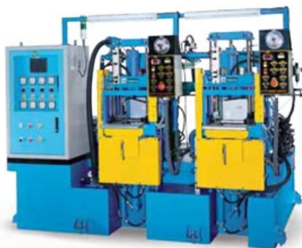
拍板左移 雙機型 LEFTSIDE OPEN TYPE - DOUBLE STATION